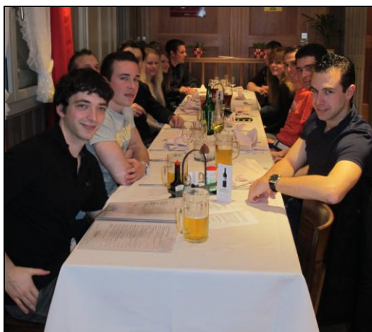
Saisonabschluss Unihockey im Brännli